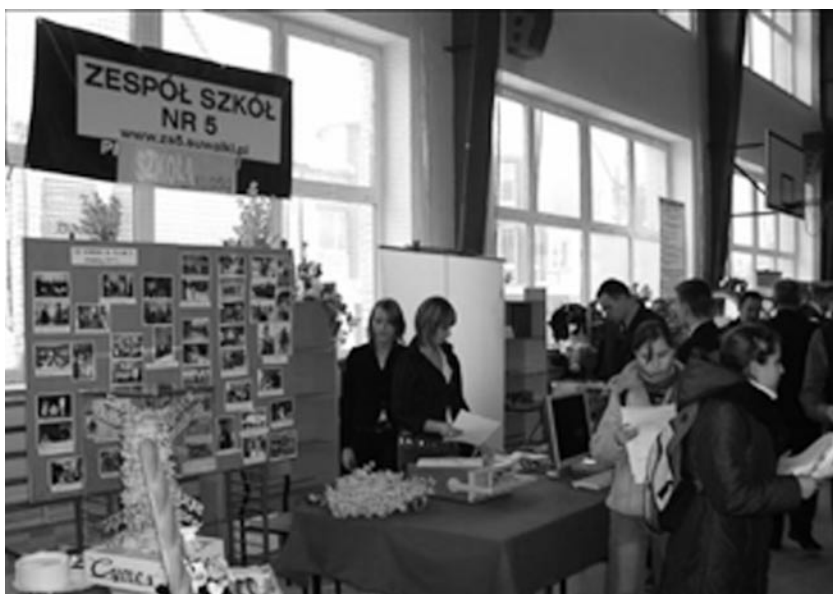
Targi Edukacyjne 2006r.

Przez 5 lat działalności SODN zrealizowaliśmy: