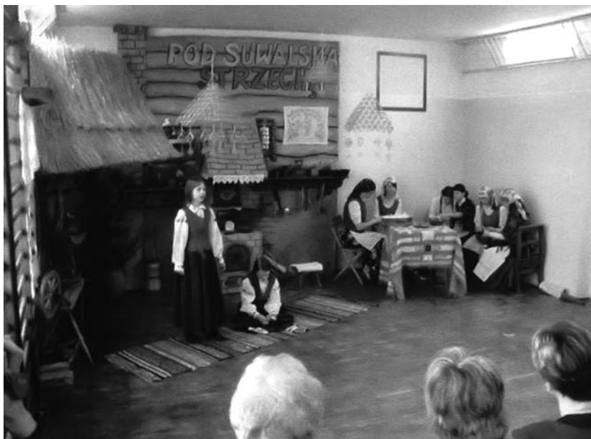
Konferencja „Pod suwalską strzechą” 2006r.