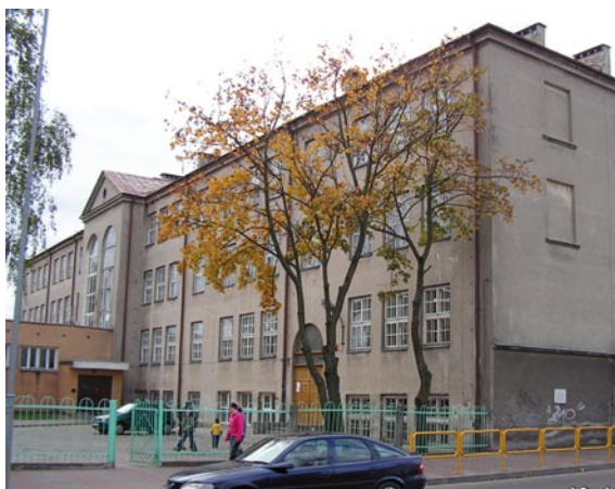
Budynek ZS 8