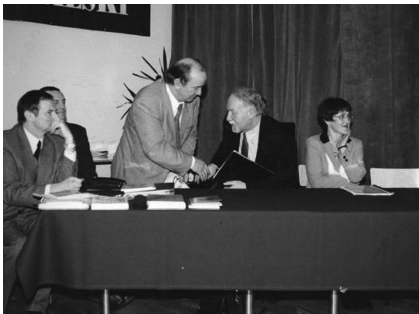
Konferencja Nauczycieli Kształcenia Zawodowego 2002 r.