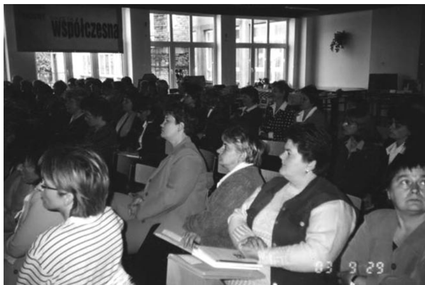
Konferencja „O uśmiech dziecka – zagrożeni na starcie” 2003 r.